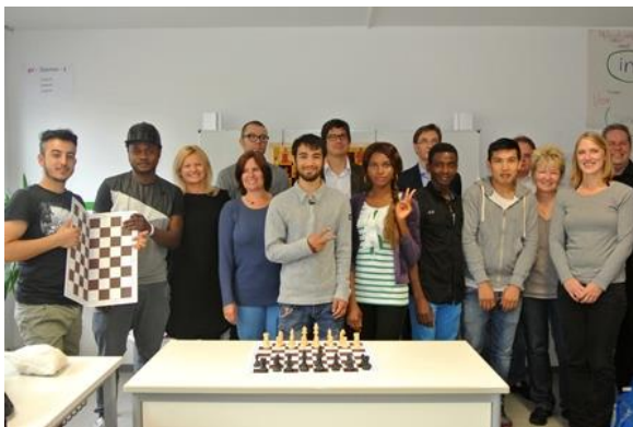
BU: Lehrer, Schüler, Schachtrainer und die Verantwortlichen der Münchener Schachstiftung sowie die Förderer sind von dem Förderkonzept „Schach nach Königsplan“ überzeugt.